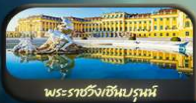
พระราชวังเชินบรุนน์