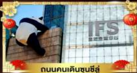
ถนนคนเดินชุนชี่อู่

เที่ยวอุทยานสวรรค์ระดับ 5A จิวจ้ายโกว "ภูเขาสี่ดรุณี" อุทยานชื่อดังเหนียงชาน