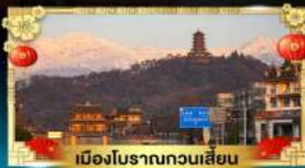
เมืองโบราณกวนเสียน