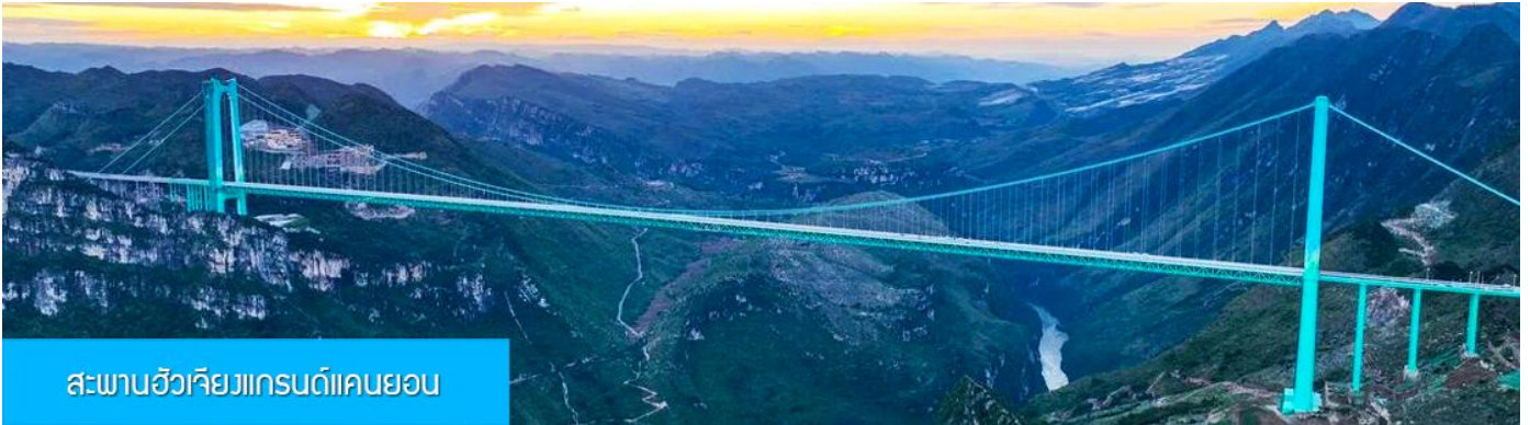
สะพานฮัวเจียงแกรนด์แคนยอน

รับประทานอาหารเช้า ณ ภัตตาคาร (มื้อที่ 7)