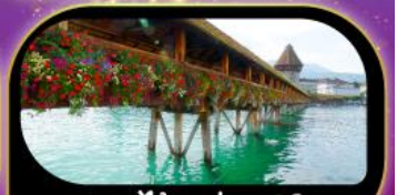
สะพานไม้ฆาปค ลูซิริน