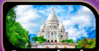
วิหารสกรเทอร์ มงมาร์ต