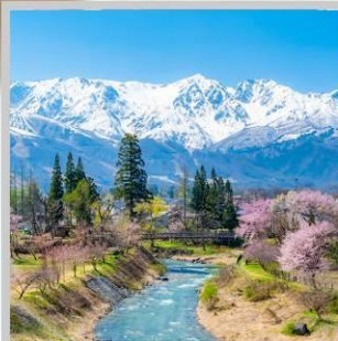
“HAKUBA OIDE PARK”