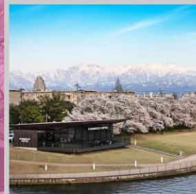
"TOYAMA KANSUI PARK"