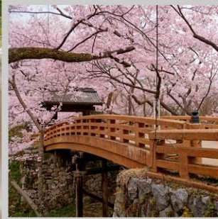
“TAKATO CASTLE RUINS”