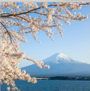
“LAKE KAWAGUCHIKO SAKURA”