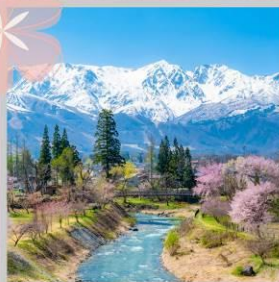
"HAKUBA OIDE PARK"