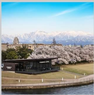
“TOYAMA KANSUI PARK”