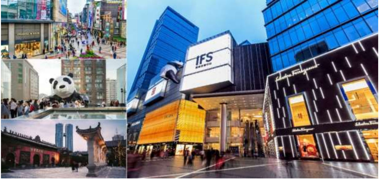
อิสระอาหารค่ำ ตามอัธยาศัย

ที่พัก HOLIDAY INN EXPRESS CHENGDU WUHOU หรือเทียบเท่า 4 ดาวจีน