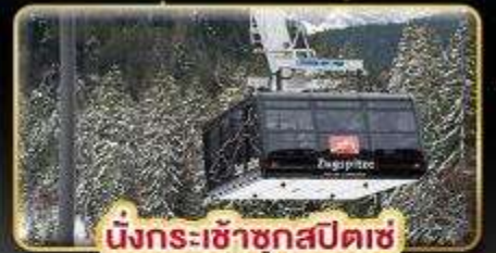
นั่งกระเช้าชุกสปีตซ์