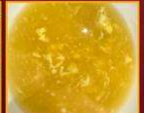
ซุปรข้าวโพด