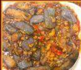
มะเขืออบหม้อดิน