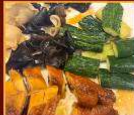
ไก่ แดงกวา เห็ดหูหนู