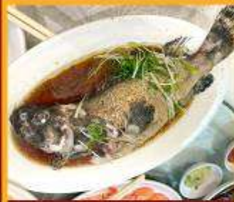
ปลาหนึ่งซีอิ้ว