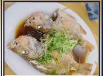
ปลาหนึ่งซีอิ๊ว