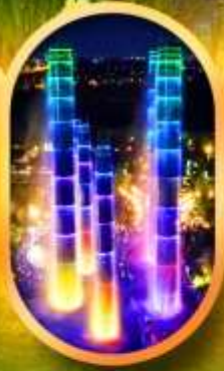
SKP Global Center