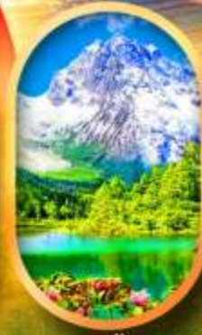
อุทยานปี้ฝิงโกว