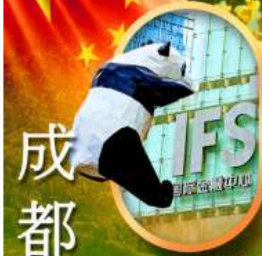
IFS หมีแพนด้าป็นตึก