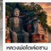
หลวงพ่อดเล่าซาน