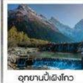
อุทยานปี้เผิงโกว