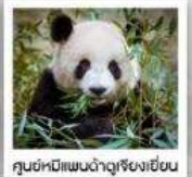
ศูนย์หมีแพนด้าดูเจียงเยียน