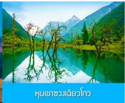
หุบเขาชวงเฉียวโกว