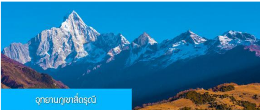
อุทยานภูเขาสี่ดรุณี

พักที่ HOLIDAY INN EXPRESS HOTEL โรงแรมระดับ 4 ดาวท้องถิ่น หรือเทียบเท่าย่านสนามบินเทียนฝู