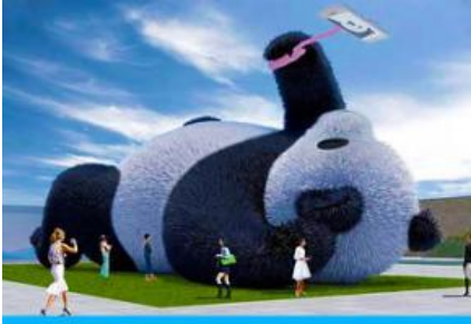
ตุ๊กตาแพนด้าออนไลน์