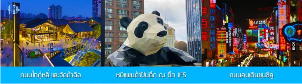
ถนนไท่กุ่หลี่ และวัดต้าจื่อ