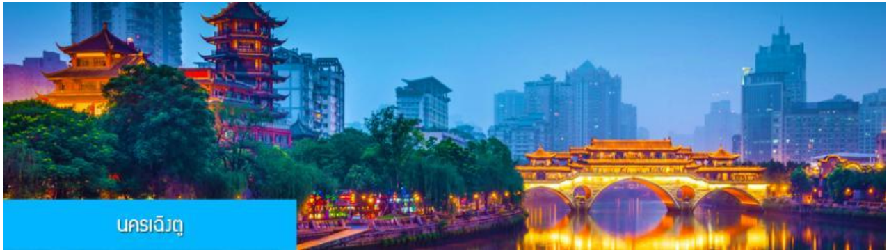
นครเฉิงตู