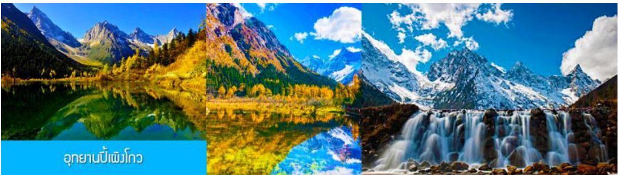
อุทยานเป่ย์ผิงโกว

หลังอาหารนำท่านเที่ยวชม อุทยานเป่ย์ผิงโกว 毕鹏沟景区 ที่เป็นแหล่งท่องเที่ยวธรรมชาติที่สวยงามได้รับฉายาว่าเป็นสวิตเซอร์แลนด์แดนใต้แห่งเมืองเสฉวน ตั้งอยู่เหนือระดับน้ำทะเลระหว่าง 2,015 เมตร – 3,500 เมตร ครอบคลุมพื้นที่ 614 ตารางกิโลเมตร ได้รับการขึ้นทะเบียนเป็นอุทยานท่องเที่ยวธรรมชาติระดับ 4A ของจีนในปี ค.ศ. 2013 และกลายเป็นอุทยานท่องเที่ยวยอดนิยมที่มีนักท่องเที่ยวเดินทางมาเยือนในปี 2023 ...นำท่านขึ้นรถบัสของอุทยานเพื่อเข้าไปยังเขตอุทยาน นำท่านขึ้นรถกอล์ฟแวะเที่ยวจุดชมวิวสำคัญต่าง ๆ ภายในเขตอุทยาน ที่ประกอบด้วย ธารน้ำแข็งและภูเขาหิมะ โอบล้อมอุทยาน ทะเลสาบที่มีสีน้ำเขียวมรกต ป่าไม้ ลำธารน้ำใสสะอาด น้ำตก หุบเขายาวบนพื้นที่สูง ใบไม้เปลี่ยนสีและป่าไม้หลากสีในฤดูใบไม้ร่วง หุ่นดอกไม้ในฤดูใบไม้ผลิ โดยมีจุด