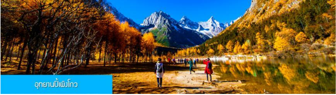
อุทยานเป่ย์ผิงโกว