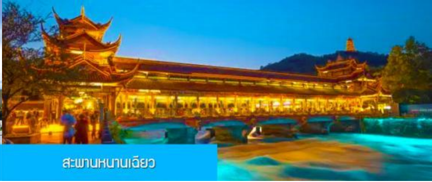
สะพานหนานเจียว