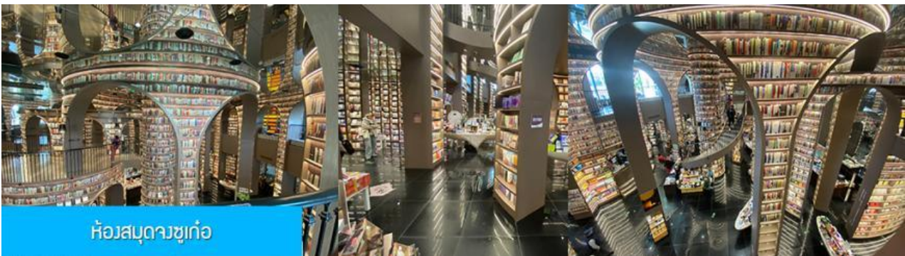
ห้องสมุดจงชู่เก๋อ

หลังอาหารนำท่านชม สะพานหนานเจียว 南桥 สะพานโบราณพร้อมแม่น้ำจูเจียงเย็นขึ้นชื่อที่ได้กลายเป็นแหล่งท่องเที่ยวสำคัญและจุดเช็คอินสำหรับนักท่องเที่ยว ในช่วงค่ำที่นี่จะประดับประดาด้วยแสงสี บริเวณริมแม่น้ำจะถูกประดับด้วยแสงไฟสีฟ้าที่ทอดยาวไปตามแนวแม่น้ำ ชาวบ้านตั้งชื่อว่าเป็น น้ำตาสีฟ้า 蓝色眼泪 พักที่ โรงแรม CENTER INTER HOTEL ระดับ 4 ดาวท้องถิ่นหรือเทียบเท่าในเมืองจูเจียงเย็น