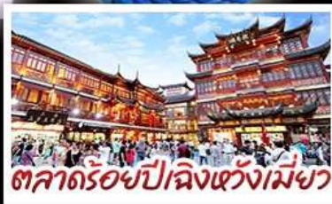
ตลาดร้อยปีเฉิงหวังเมี่ยว