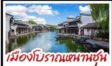
เมืองโบราณหนานชุน

DISNEYLAND SHANGHAI เต็มวัน เมืองโบราณหนานชุน (รวมล่องเรือ) - วัดจิ่งอัน เมืองโบราณหนานชุน - ตลาดร้อยปีเฉิงหวังเมี่ยว มือพิเศษ บุฟเฟ่ต์ BBQ, เสี่ยวหลงเปา