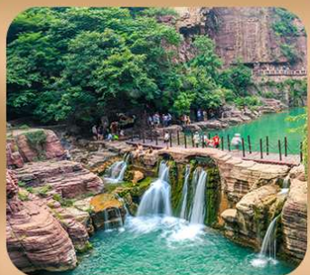
“อุทยานหยุนไท่ซาน”

ชมกำแพงเหมิน มรดกโลกที่เมืองลั่วหยาง • สุสานจีนซีฮ่องเต้ • ศาลเจ้ากวนอู วัดเส้าหลิน + ป่าเจดีย์ + ชมโชว์กังฟู • เมืองโบราณลั่วอี้ • อุทยานหยุนไท่ซาน เจดีย์ห่านป่าใหญ่ • ถนนวัฒนธรรมต้ากิง • ถนนคนเดินอิสลาม • จัตุรัสหออระขิง