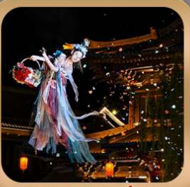
“เมืองโบราณลั่วอี้”

ชมกำแพงเหมิน มรดกโลกที่เมืองลั่วหยาง • สุสานจีนซีฮ่องเต้ • ศาลเจ้ากวนอู วัดเส้าหลิน + ป่าเจดีย์ + ชมโชว์กังฟู • เมืองโบราณลั่วอี้ • อุทยานหยุนไท่ซาน เจดีย์ห่านป่าใหญ่ • ถนนวัฒนธรรมต้ากิง • ถนนคนเดินอิสลาม • จัตุรัสหออระขิง