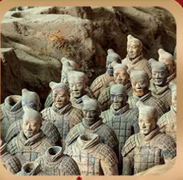
“สุสานจีนซีฮ่องเต้”