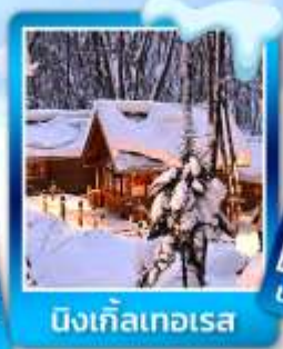
นิงเกียวทสุมิ