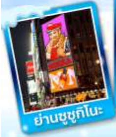
ย่านชูชุกิโนะ