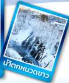
มัตสูกาวา