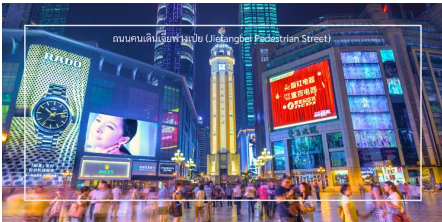
ถนนคนเดินเจี๋ยฟางเป่ย์ (Jiefangbei Pedestrian Street)

สมควรแก่เวลา นำท่านสู่ ถนนคนเดินเจี๋ยฟางเป่ย์ (Jiefangbei Pedestrian Street) เป็นหนึ่งในแหล่งช้อปปิ้งและท่องเที่ยวที่สำคัญที่สุดในเมืองฉงชิ่ง (Chongqing) เป็นพื้นที่ที่มีชีวิตชีวาและคึกคัก มีร้านค้า ร้านอาหาร และสถานบันเทิงมากมาย ถนนนี้ตั้งอยู่ใกล้กับสถานที่ท่องเที่ยวสำคัญอื่นๆ เช่น มหาศาลาประชาชนแห่งเมืองฉงชิ่ง ทำให้สามารถเดินเที่ยวชมได้อย่างสะดวก ถนนสายนี้มีบรรยากาศที่มีชีวิตชีวา โดยเฉพาะในช่วงเย็นที่มีแสงไฟและการแสดงต่างๆ ที่ทำให้บรรยากาศน่าสนใจยิ่งขึ้น และยังเต็มไปด้วยร้านค้าแบรนด์เนม ร้านค้าท้องถิ่น และตลาดที่ขายสินค้าต่างๆ เช่น เสื้อผ้า เครื่องประดับ และของที่ระลึก ท่านสามารถ แวะซื้อร้านดัง “POPMART” ร้านดังจากจีน ที่รวมพิกเกอร์ดีไซน์เก๋และตุ๊กตาน่ารักหลากหลายซีรีส์ยอดนิยม เช่น Molly, Dimoo, Labubu และอีกมากมาย ที่สายสะสมของเล่นไม่ควรพลาด