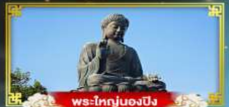
พระใหญ่ของปิง