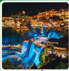
ฟู่หลงเจิน