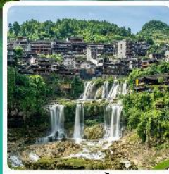
ฟูรงจิ้น

• โฮลท์ อุกยานเทียนเหมินซาน หุบเขาอวตาร เมืองโบราณเซียนเอน หมู่บ้านโบราณฟูรงจิ้น ภูเขาโรมาอู่จียโต อุกยานชื่อจื่อกวนด่านสิงโต