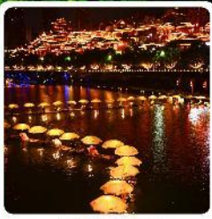
เมืองเซียนเอน