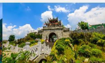
เมืองโบราณซิงเหยียน

*ทางบริษัทฯ ขอสงวนสิทธิ์ในการสลับโปรแกรมทัวร์ตามความเหมาะสมขึ้นอยู่กับสถานการณ์หน้างาน โดยคำนึงถึงผลประโยชน์ของลูกค้าเป็นสำคัญ