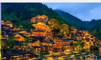
หมู่บ้านโบราณฉูเจียงจ้าย