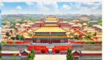
พระราชวังต้องห้ามปักกิ่ง

*ทางบริษัทฯ ขอสงวนสิทธิ์ในการสลับโปรแกรมทัวร์ตามความเหมาะสมขึ้นอยู่กับสถานการณ์หน้างาน โดยคำนึงถึงผลประโยชน์ของลูกค้าเป็นสำคัญ