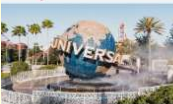
สวนสนุกยูนิเวอร์แซลปักกิ่งสตูดิโอ