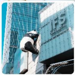
IFS ตึกหมีแพนด้า

● ไอโกล์ นั้งกระเข้าขั้นชมกุหลาบหิมะวาจู่ ซึ่บปั้งถนนซุนซีลู่ แลนด์มาร์คแพนด้ายักเป็นตึก IFS เจียงตู