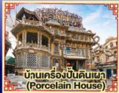
บ้านเครื่องปั้นดินเผา (Porcelain House)