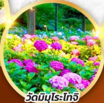
วัดมิมุโระโทจิ