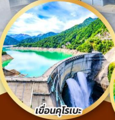
เขื่อนคุโรเบะ