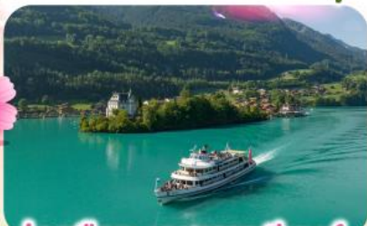
ล่องเรือทะเลสาบเบรียนซ์

พิชิตยอดเขาชุนเนกกา 1 ในเขาที่สวยงามที่สุดเมืองเซอร์แมท