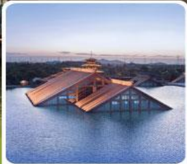
พิพิธภัณฑ์ไดน้ำกงฟู่หลิน