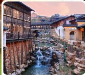
เมืองโบราณเหย่าหู