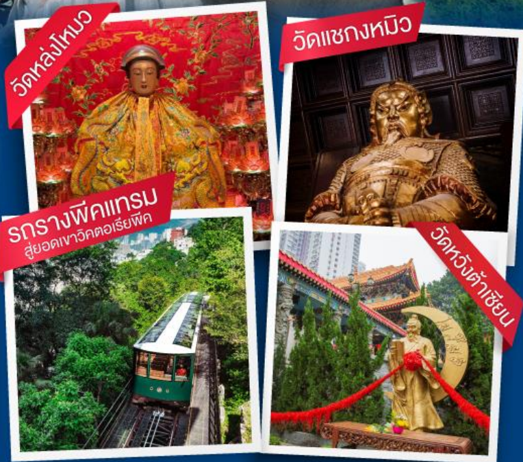
วัดหล่งโคม