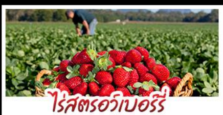
ไรศตรอบออร์รี่

คฤหาสน์เหวินเจิง - สวนซาถูระซิงเต่า ไรศตรอบออร์รี่ - โรงเบียร์ซิงเต่า