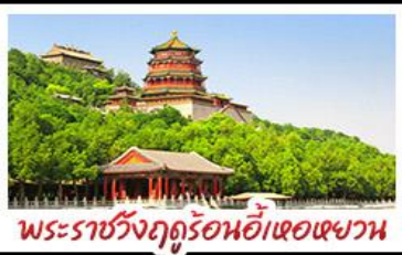
พระราชวังฤดูร้อนอี้ทงหยวน

มือพิเศษ เปิดปีกถึง สุกิมองโก MICHELIN GUIDE ร้าน TAO TAO JU