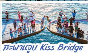
สะพานจูบ Kiss Bridge