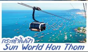
กระเช้าไฟฟ้า Sun World Hon Thom