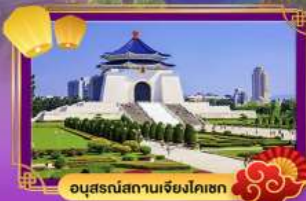
อนุสรณ์สถานเจียงไคเชก