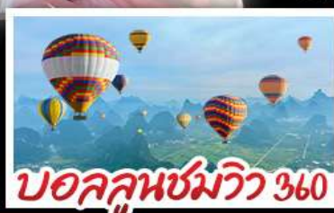
บอลลูนชมวิวก 360