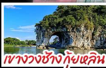
เขางวงช้างกัซแอลิน