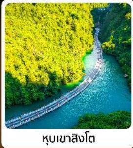
คุบเขาสิงโต

ไฮไลท์! ปีนตรงลงเอนชอ ที่ยาวเอนชอนั้นๆจัดเต็มทั่วเมือง คุบเขาสิงโต ผิงซานแกรนด์แคนยอน อุทยานจิ้นลี่ซาน