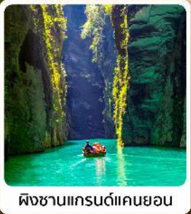
ผิงซานแกรนด์แคนยอน