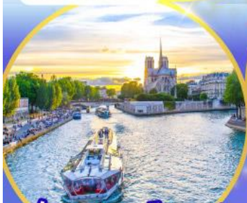
ล่องเรือแม่น้ำเซน