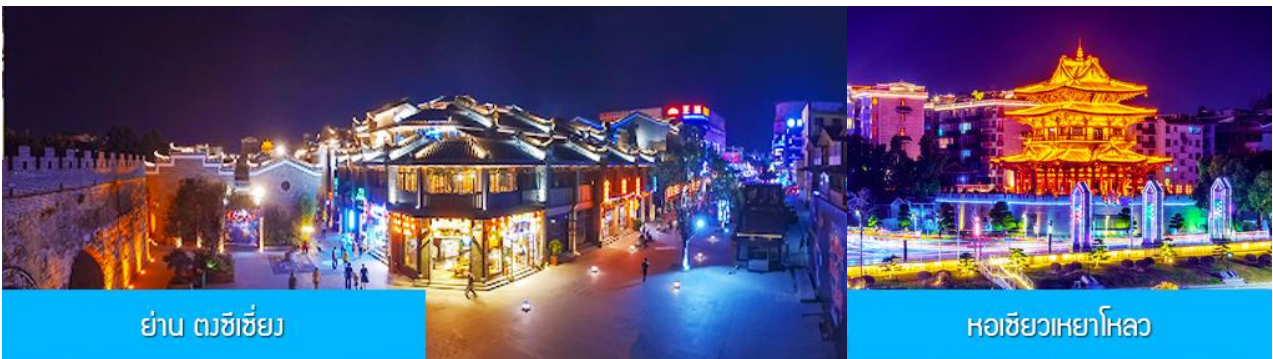
ย่าน ดงซีเจียง