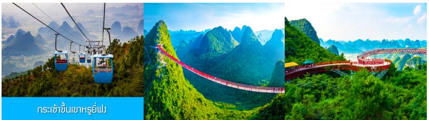
กระเช้าขึ้นเขาหฺรูยี่ฟง

อัตราค่าบริการสำหรับโปรแกรมเสริมการแสดงชุด The Impression of Liu san jie ท่านละ 350 หยวน ระยะเวลาที่ใช้ในการเที่ยวชมการแสดง ประมาณ 2 ชั่วโมงครึ่ง รวมเวลาเดินทางไป กลับ ค่าบริการรวม ค่าบัตรเข้าชม ค่ารถรับ ส่ง และค่าน้ำดื่มของไกด์ท้องถิ่น ที่พักที่ YANGSHUO ELITE HOTEL ระดับ 4 ดาวท้องถิ่นหรือเทียบเท่าใน เมืองหยางชัว