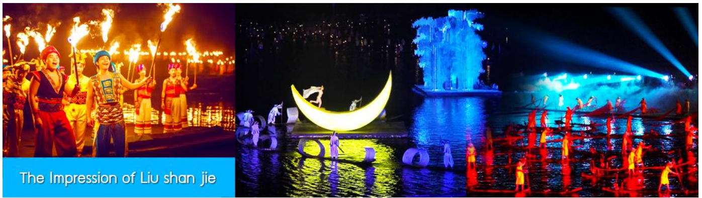
The Impression of Liu shan jie

จากนั้นนำท่านเดินทางเข้าที่พัก หรือท่านสามารถเลือกซื้อโปรแกรมเสริม เป็นบัตรชมการแสดง ชุด The Impression of Liu shan jie หรือที่เรียกกันในหมู่นักท่องเที่ยวไทยว่า โชว์แม่น้ำ เป็นการแสดงบนแม่น้ำหลีเจียงที่ทุ่มทุนสร้างอย่างสุดอลังการ เป็นการแสดงที่น่าดูชมที่สุดในเมืองกุ้ยหลิน การแสดงชุดนี้ใช้แม่น้ำหลีเจียงเป็นเวทีการแสดง โดยมีฉากหลังเป็นภูเขาริมแม่น้ำ ซึ่งให้ความรู้สึกสมจริงเสมือนผู้ชมและนักแสดงอยู่ท่ามกลางธรรมชาติ ใช้ทีมงานนักแสดงหลายร้อยคน และระบบแสง สี เสียง ที่ทันสมัยประกอบในการแสดง