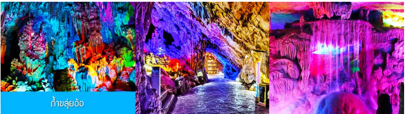
ถ้ำขลุ่ยอ้อ

พักที่ VIENNA INTER HOTEL ระดับ 4 ดาวท้องถิ่นหรือเทียบเท่าในเมืองกุ้ยหลิน