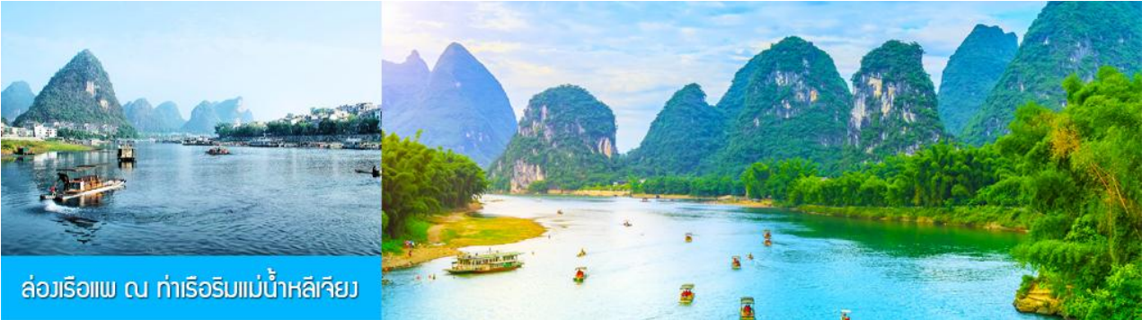
ล่องเรือแพ ณ ท่าเรือริมแม่น้ำหลีเจียง