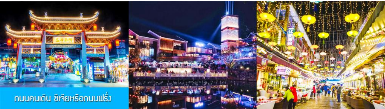
ถนนคนเดิน ซิเจียหรือถนนฝรั่ง