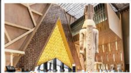
พิพิธภัณฑ์แกรนด์อียิปต์(GEM)

อารยธรรมลุ่มแม่น้ำไนล์ - พีระมิด - อเล็กซานเดรีย - เมมฟิส - ไคโร - โรงแรมระดับ 4 ดาว รวมค่าวีซ่า ทัศนะทะเลทราย - อาหารครบทุกมื้อ