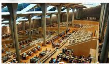
เขื่อนสิมุดอเล็กซานเดรีย