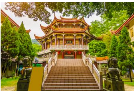
วัดหนานถ้าวชื่อ

พักที่ โรงแรม XIAMEN HENGLONG HOTEL 4* หรือเทียบเท่าในเมืองเซี่ยเหมิน