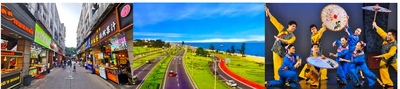
ถนนวซาลู่

พักที่ โรงแรม XIAMEN HENGLONG HOTEL 4* หรือเทียบเท่าในเมืองเซี่ยะเหมิน