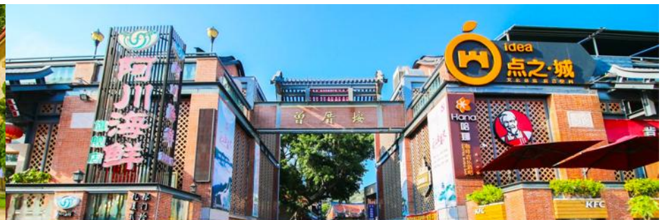
หมู่บ้านชาวประมง เจิงจ้าวอัน