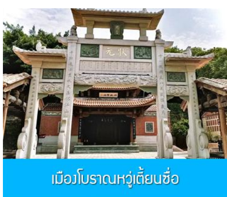
เมืองโบราณหวู่เตี้ยนซือ

พักที่ โรงแรม XIAMEN HENGLONG HOTEL 4* หรือเทียบเท่าในเมืองเซี่ยเหมิน