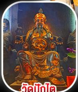
วัดทิ่กิต