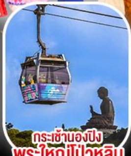
กระเช้าเองปีง พระใหญ่ไผ่หลิน