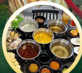
ชาบูฮ่องกง