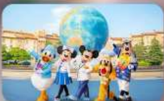
อิสระตามอียาสัย 2 วัน

HOTEL ASIA NARITA ห้องเตียงสามมาตรฐานคู่เตียง HOTEL ASIA NARITA ห้องเตียงสามมาตรฐานคู่เตียง HOTEL ASIA NARITA ห้องเตียงสามมาตรฐานคู่เตียง