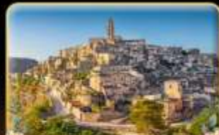
ตามรอย 007 เมือง Matera