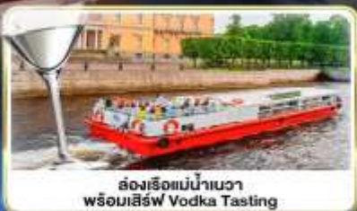
ล่องเรือแม่น้ำวอวา พร้อมเสิร์ฟ Vodka Tasting

📅 เดินทาง : 14-21 มิ.ย.69 / 28 มิ.ย.-05 ก.ค.69 / 24-31 ก.ค.69