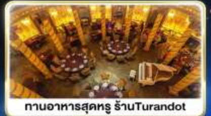
ทานอาหารสุดหรู ภัตตาคาร Turandot