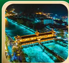
“สะพานหนานเฉียว น้ำคาสีฟ้า”