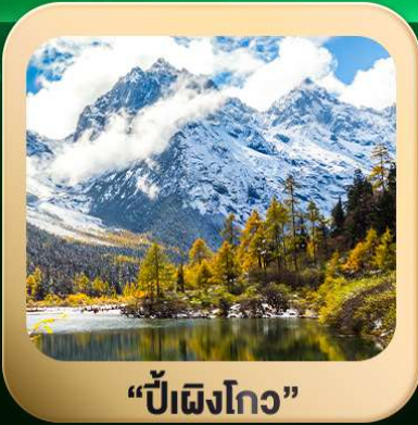
“ปี่ฝิงโกว”

ชมธรรมชาติ 2 อุทยานขึ้นชื่อ อุทยานภูเขาสีดรุณี + อุทยานปี่ฝิงโกว สะพานหนานเฉียว • ถนนคนเดินไท่กู่หลี่ + ซุนซีลู่ + Pop Mart • ตงเจียวจื่อ