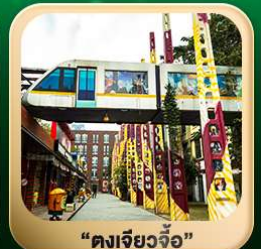
“ตงเจียวจื่อ”