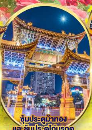
ชมประติมากรรม และ ชมประตูโถงมรกต