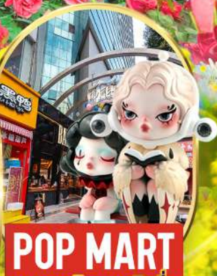
POP MART ถนนคนเดินหนานผิงเจีย