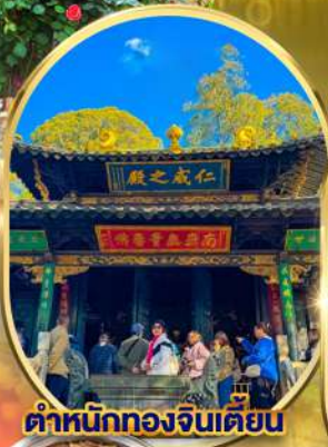
ตำหนักทองจินเตียน