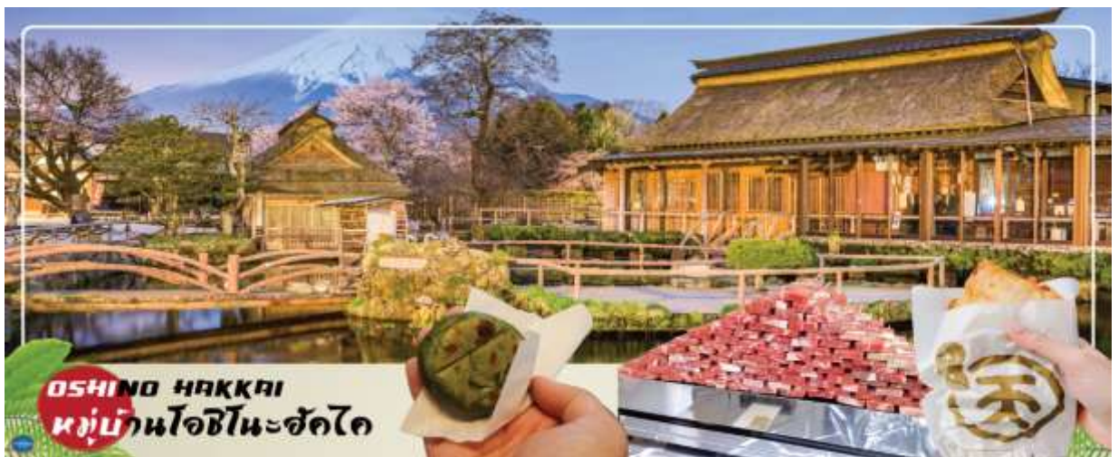
OSHINO HAKKAI หมู่บ้านโอชิโนะฮัคไค

หรือ เทศกาลชมดอกกลาเวนเดอร์ที่ทะเลสาบคาวากูจิ Fuji Kawaguchiko Herb Festival (ซึ่งมีที่ผ่านมาเทศกาลอยู่ในช่วงวันที่ 21 มิถุนายน – 21 กรกฎาคม 2025) จัดขึ้นที่ริมทะเลสาบคาวากูจิในช่วงต้นฤดูร้อน ซึ่งนอกจากจะจัดขึ้นเพื่อต้อนรับฤดูชมดอกกลาเวนเดอร์แล้ว ยังจะได้เพลิดเพลินไปกับความงามของดอกไม้หลากชนิด เช่น ดอกคาโมมายล์และสมุนไพรมากมาย โดยสถานที่จัดงานหลักคือ สวนสาธารณะยากิซาคิ (Yagizaki Park) สวนยอดนิยมที่ดึงดูดนักท่องเที่ยวมากมายด้วยลาเวนเดอร์ชอฟคริมและชาสมุนไพร์ และสวนสาธารณะโออิชิ (Oishi Park) ที่มีภาพภูเขาฟูจิซึ่งเป็นฉากหลังของทะเลสาบคาวากูจิตัดกันกับภาพทุ่งดอกกลาเวนเดอร์อย่างสวยงาม อิสระให้ท่านได้วิ่งเล่นท่ามกลางทุ่งดอกกลาเวนเดอร์สีม่วงสดใส สัมผัสกลิ่นหอมสดชื่น และเพลิดเพลินกับทิวทัศน์อันงดงาม พร้อมเก็บภาพความประทับใจตามอัธยาศัย (ดอกกลาเวนเดอร์จะบานหรือไม่นั้น ทั้งนี้ขึ้นอยู่กับสภาพอากาศ สงวนสิทธิ์หากช่วงวันเดินทางลาเวนเดอร์ไม่มาแล้ว ก็ยังสามารถปรับโปรแกรมได้โดยไม่ต้องแจ้งล่วงหน้า)