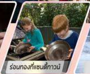
ร้อนท้องที่แซนดี้ทาวน์