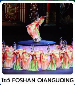
โชว์ FOSHAN QIANGQING