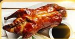
เปิด Four Season