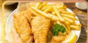
Fish and Chips