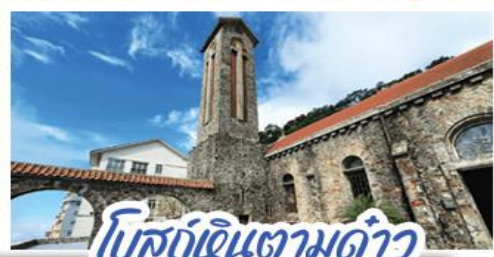
โบสถ์หินตามด้าว