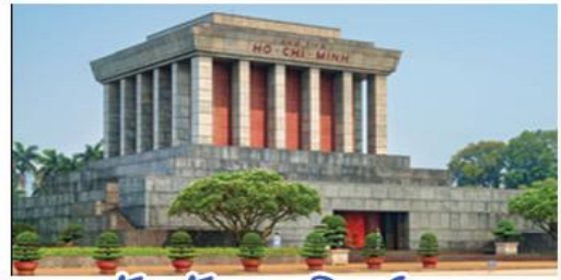
จัตุรัสบาติงห์