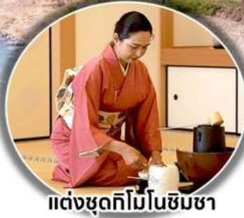
แต่งชุดกิโมโนชิมชา