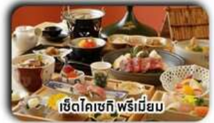
เซตโคเชกิ พรีเมียม