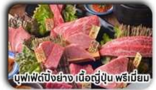
บุฟเฟ่ต์บั้งย่าง เนื้อญี่ปุ่น พรีเมียม